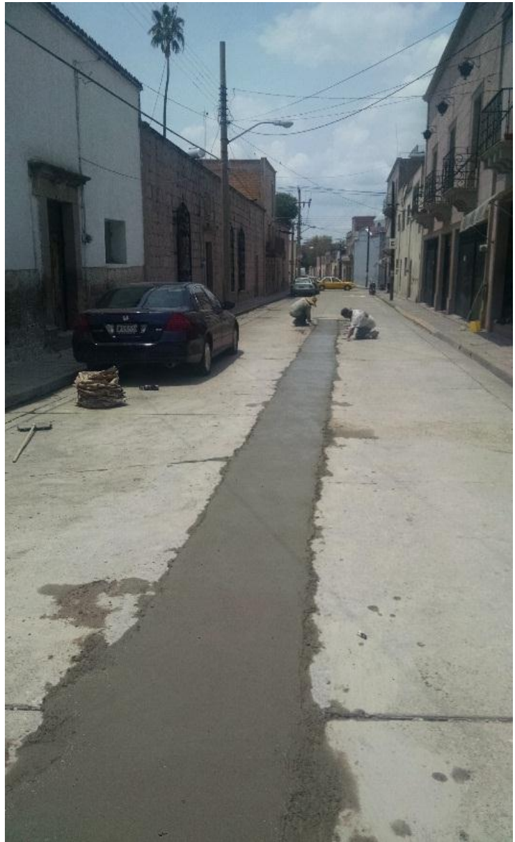
Calle Javier Mina